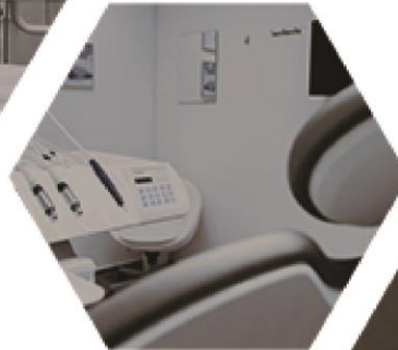
미니다큐형식 생동감 있게 촬영